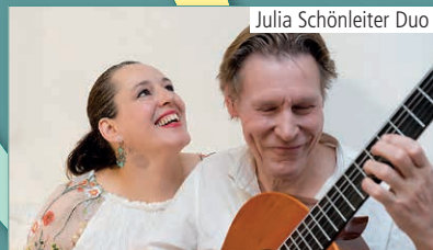
Kleine Venedig 1a

22 00 – 2 00 Schlechte Nachtgeschichten, die das Weltbild zerstören können www.via113.de