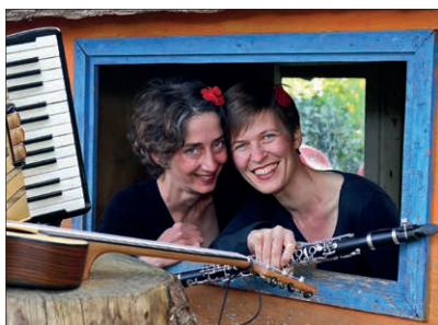
Dö van Dantje freuen sich auf ihr Publikum: Samstag, 21 Uhr im Tischlerei-Hof

Wir wünschen ein freudvolles und inspirierendes Flanieren!