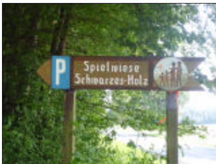
Spielwiese bei Lamspringe